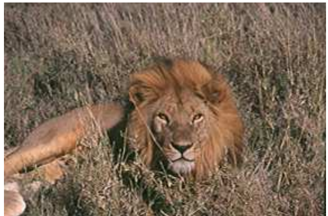
Löwe im Ngorongoro Krater